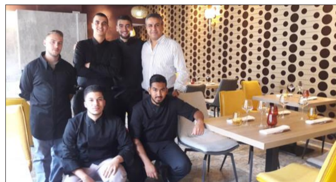
L'équipe au complet dans l'une des deux salles à manger du restaurant.

L'ancien Hôtel d'Alsace, racheté en 2014 par un investisseur privé, accueillait déjà, après sa transformation, onze logements. Depuis vendredi, Abdellatif Challa, le propriétaire des lieux, a ouvert au rez-de-chaussée le restaurant « Le Méridien ».