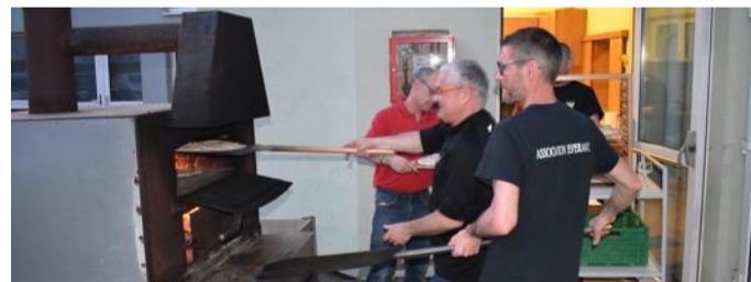
L'équipe des enfouisseurs de la soirée tartes flambées à l'œuvre.

Ces travaux permettent de restaurer des orphelinats, des hôpitaux, des centres d'accueil pour enfants défavorisés, pour sans-abri, ou personnes handicapées ainsi que des maisons individuelles pour des personnes dans le besoin. La république de Moldavie, trois millions six cent mille habitants, est l'un des pays les plus pauvres d'Europe. Corjeuti est une ville située à 300 km au nord de la capitale Chisinau. Sur les huit mille habitants, deux mille travaillent à Paris en France. Avec pour con-