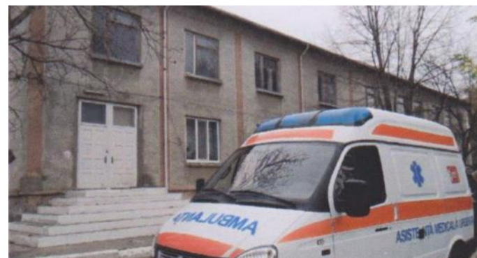
Avec leurs partenaires sur place et ceux de Roumanie, les bénévoles de l'association Espérance comptent rénover du 28 avril au 5 mai une partie du premier étage de l'ancien hôpital pour y aménager une maison de retraite pour une vingtaine de personnes.

séquence une situation désastreuse pour les personnes âgées ou malades qui ne sont plus prises en charge par les jeunes. De 1978 à 1994 il y avait un hôpital. Aujourd'hui fermé, il ne reste plus qu'un petit dispensaire qui occupe quelques locaux du rez-de-chaussée. Avec leurs partenaires sur pla-